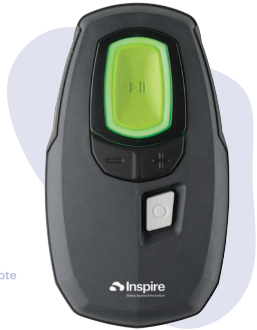
Inspire Sleep Remote

Inspire funciona dentro del cuerpo mientras duerme. Es un dispositivo pequeño que se coloca durante un procedimiento ambulatorio en el mismo día. Cuando esté listo para dormir, simplemente haga clic en el control remoto para encender el Inspire. Mientras duerme, Inspire proporciona una estimulación de las vías respiratorias, permitiéndole respirar normalmente y dormir tranquilo.